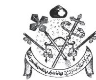
Syrisch-orthodoxe Kirche in der Schweiz Église orthodoxe syriaque en Suisse