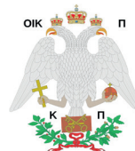
Griechisch-orthodoxe Kirche in der Schweiz Église orthodoxe grecque en Suisse